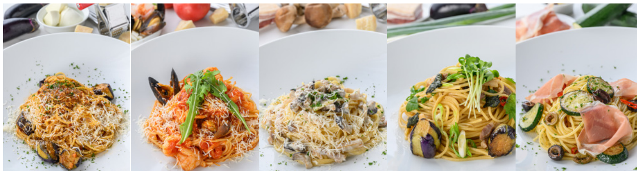
※メニュー例 画像はイメージです。